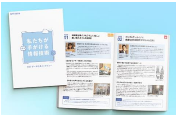
当社社員の業務紹介や中学生に向けたメッセージを掲載した冊子

小学生を対象とした IT 教育としては、当社の全国各地の拠点でプログラミング体験教室「NTT データ アカデミア」を開催しています。プログラミングや IT のしくみを子どもたちに伝える活動を通じて、「IT 教育の推進」の実現をめざしています。