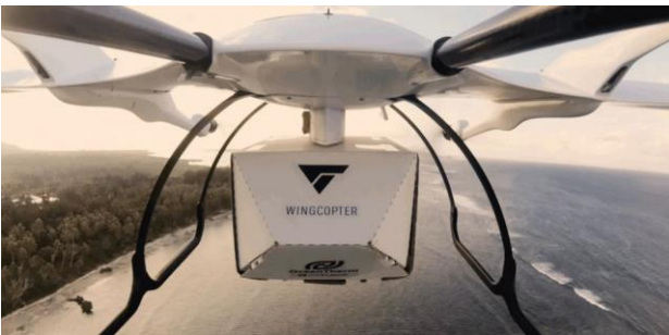
Wingcopter 社が開発したドローン

NTT DATA Business Solutions AG（ドイツ）はドローンを開発するスタートアップ企業 Wingcopter 社が、東アフリカのマラウイで取り組む医療用品のサプライチェーンを構築するプロジェクトに対して、ドローン配送のための拡張性の高いサービスプラットフォームを提供し支援しています。これには飛行計画、受注管理、ドローンやパイロットのリソース管理が含まれており、全国の医療用品カタログにも対応しています。Wingcopter 社はドローンを使用してマラウイの遠隔地に住む 11 万 5,000 人以上の人々に医療物資を届けています。また、ドローン訓練生プログラムにより、地元住民をドローンパイロットとして養成することで教育や雇用機会の創出にもつながっています。