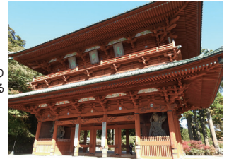
高野山の入り口にそびえる大門