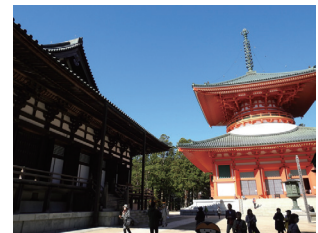
壇上伽藍は (胎藏曼荼羅) の世界を表しているという