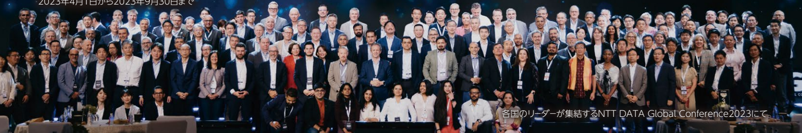
各国のリーダーが集結するNTT DATA Global Conference2023にて