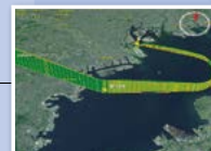
PANADESの 航空シミュレーション画像

航空路設計システム「PANADES」のタイへの提供開始 アジア各国への拡大のほか、通関システム「NACCS」 (ベトナム、ミャンマー)、橋梁監視システム「BRIMOS」 (ベトナム)への展開をはじめ、日本の社会インフラ展開へと 発展してきました。